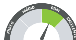
RESISTÊNCIA AO DESGASTE