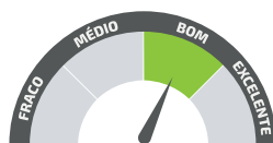
RESISTÊNCIA AO IMPACTO